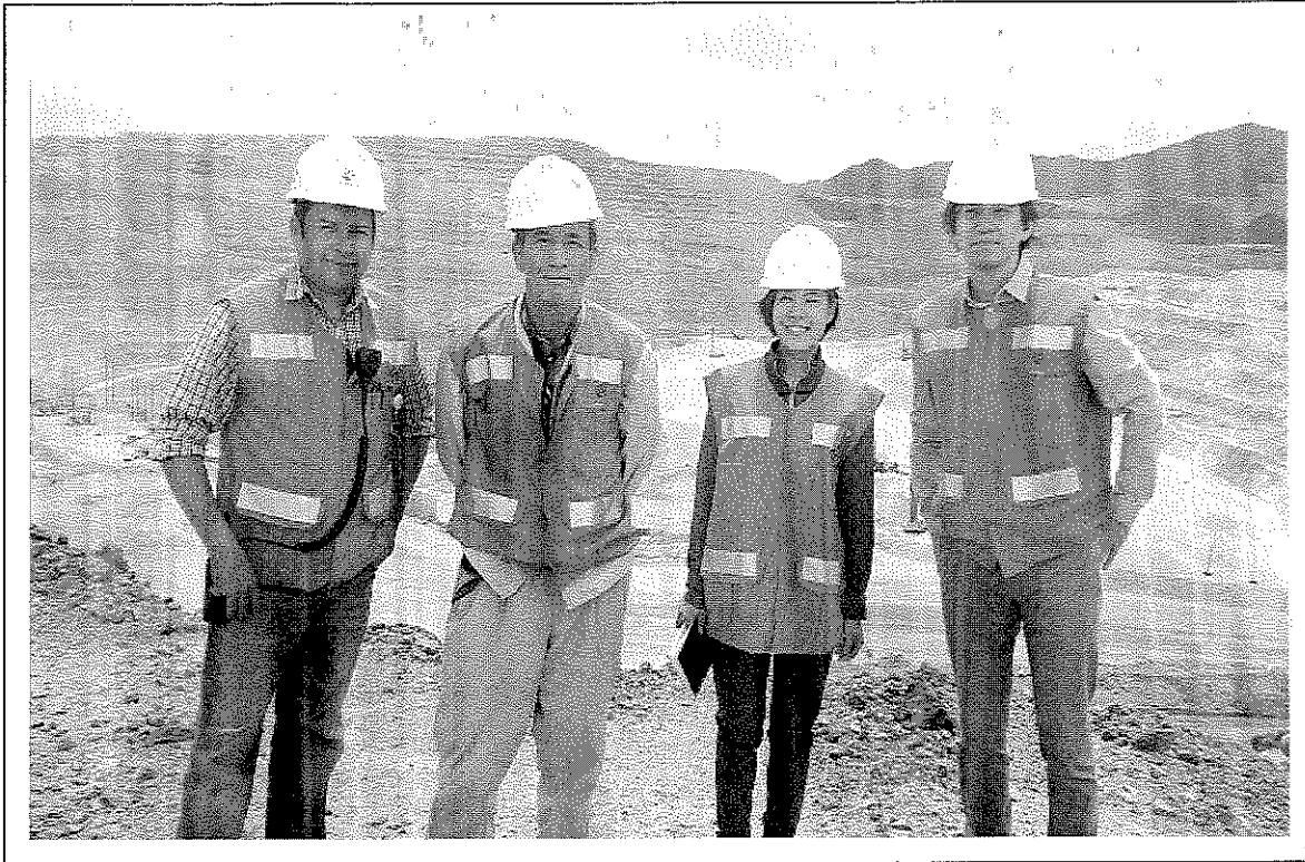
Mina de Buena Vista del Cobre, Cananea Sonora.