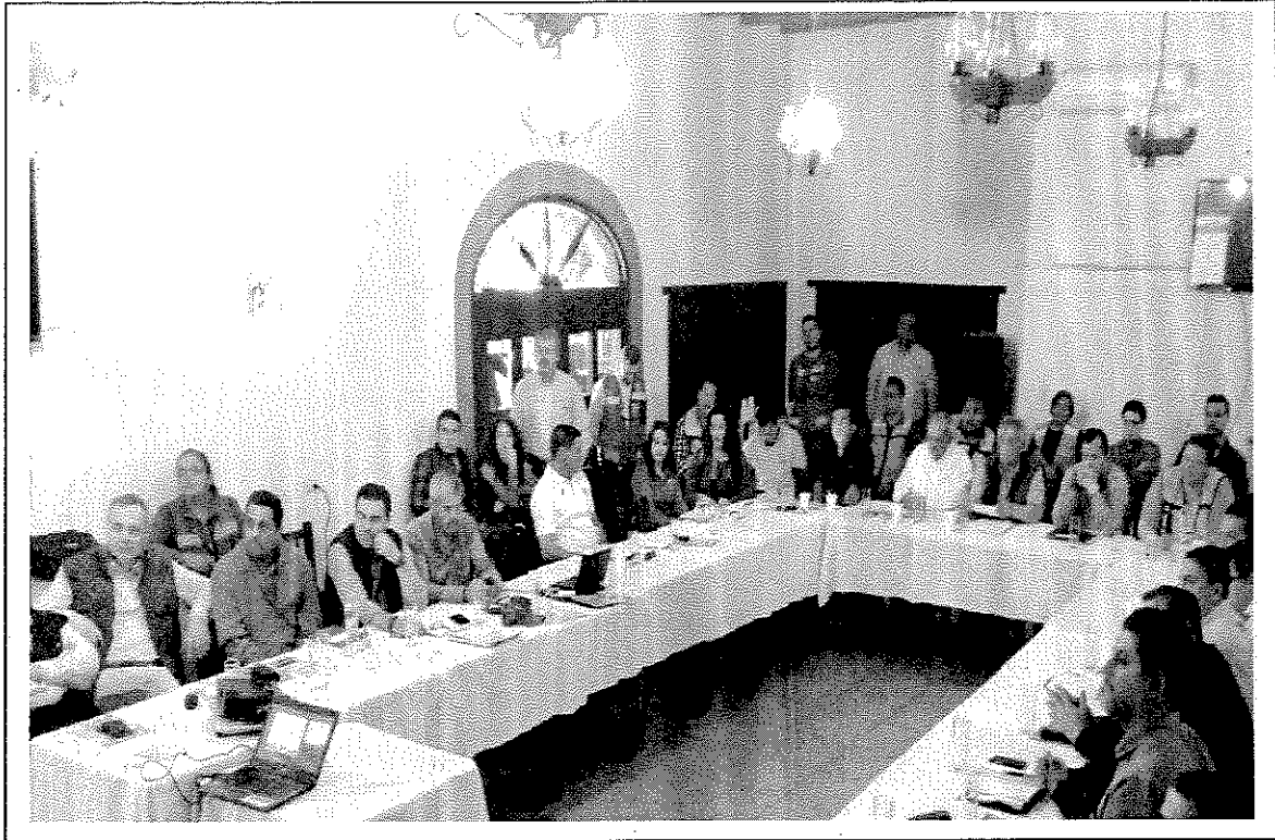
Integrantes del Comité Técnico Consultivo en Materiales Peligrosos.