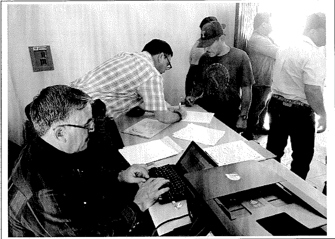
Mesa de registro de los asistentes a los cursos.