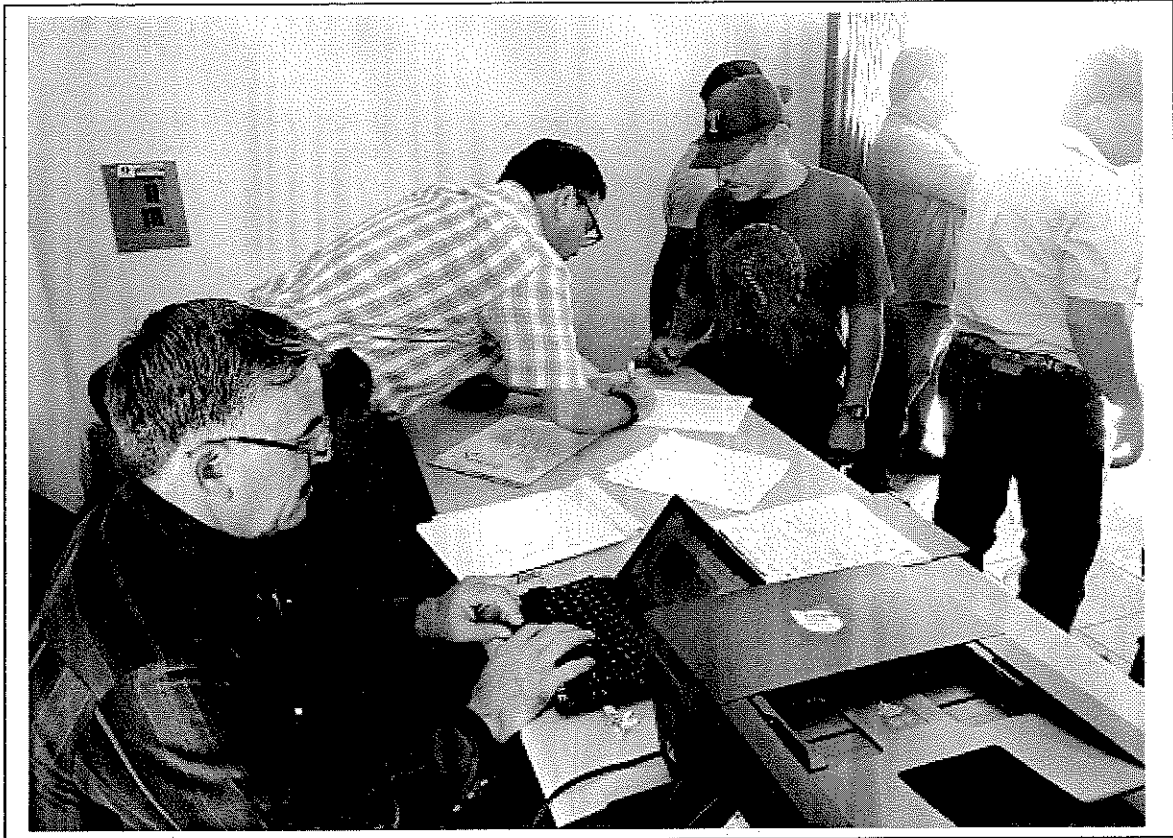
Mesa de registro de los asistentes a los cursos.