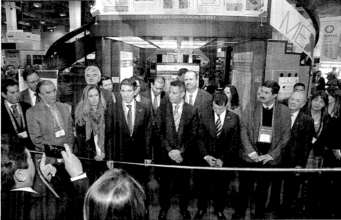
Inauguración del stand de la Delegación mexicana en la reunión anual del PDAC en la ciudad de Toronto.