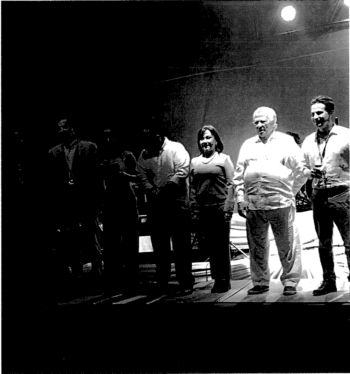
Asistencia a Evento "Vino Litoral 2018 San Carlos, Sonora; 9 y 10 de marzo de 2018.