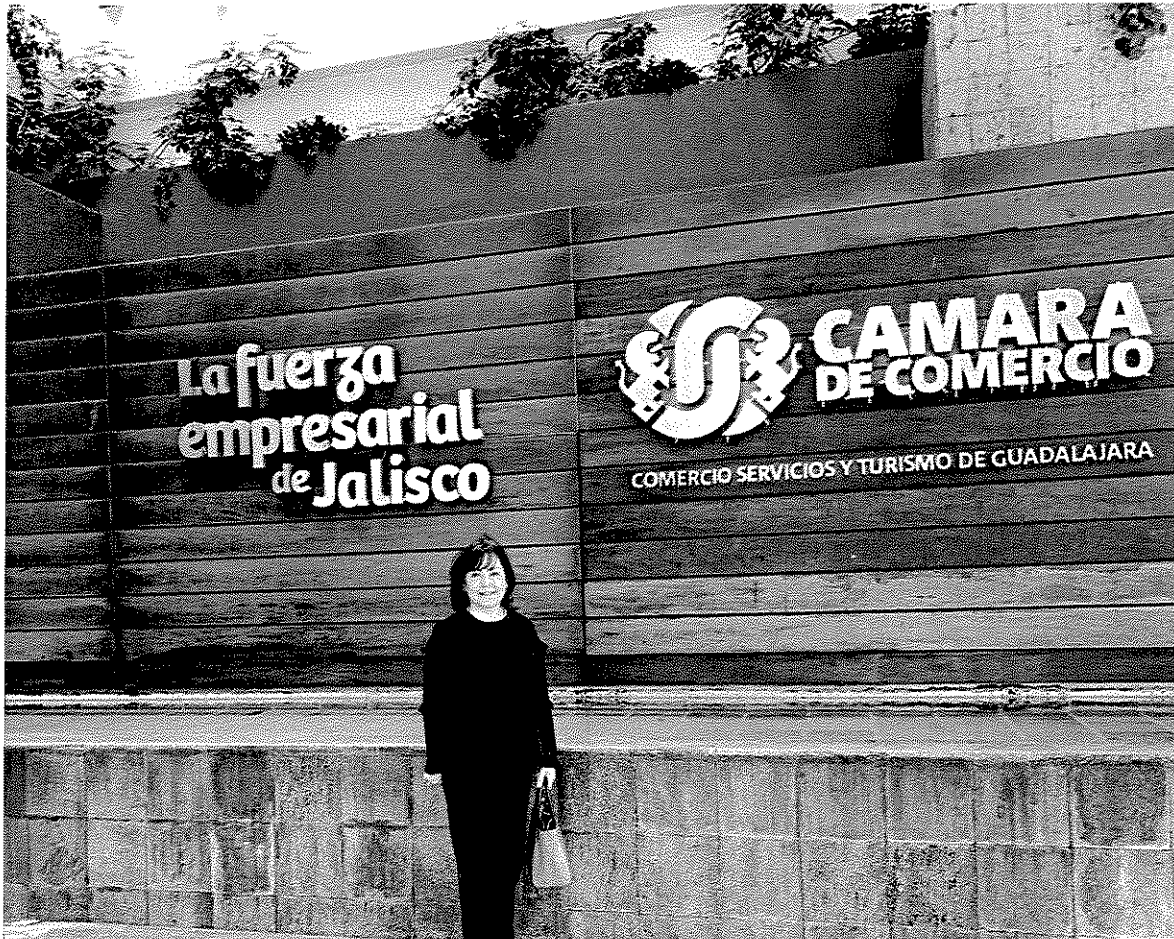
Comisión a Guadalajara, Jalisco, del 8 al 9 de febrero de 2019, con empresarios de CANACO SERVYTUR de Guadalajara.