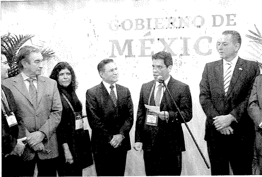
Inauguración del stand de México en la Expo PDAC Toronto 2019, con la presencia del Subsecretario de Minería y del Gobernador de Durango.