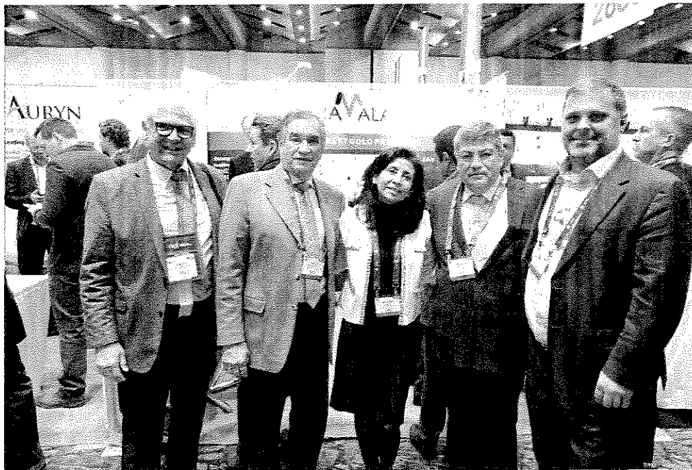
Con directivos de la empresa Minera Álamos, propietarios de la Mina en Construcción "Santa Ana", en el municipio de Yécora.