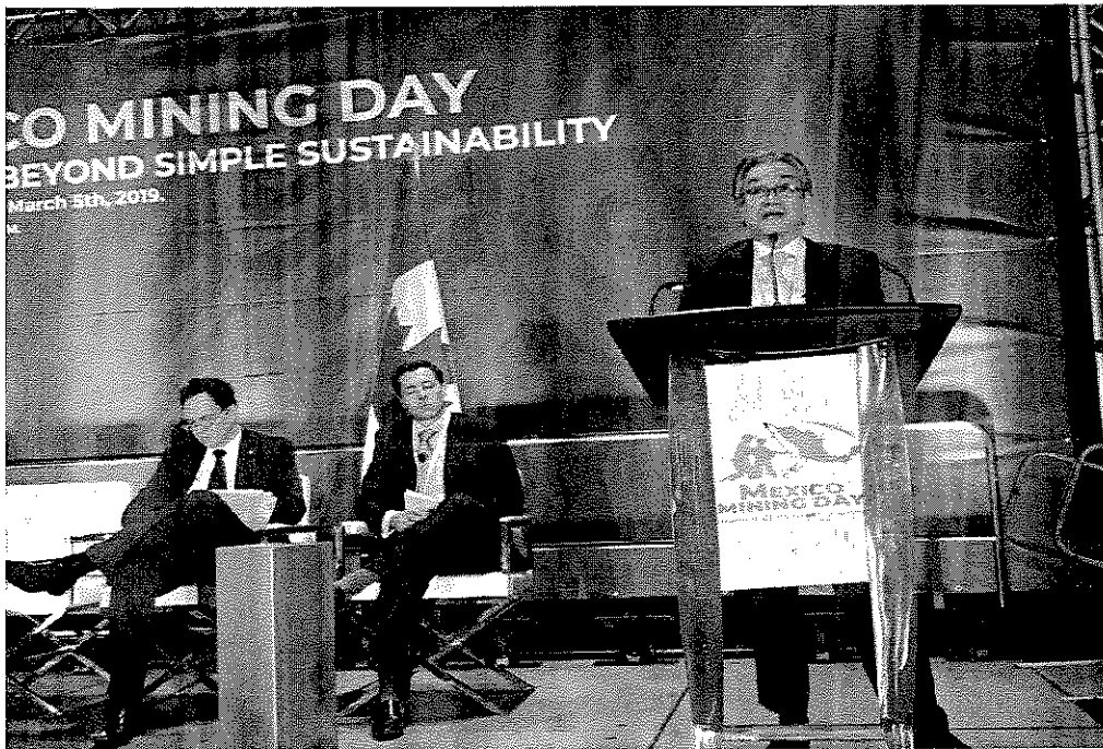
Secretario de Economía participando en el México Mining Day, junto a Secretarios de Economía de los Estados Mineros.