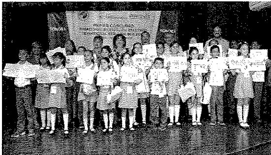
Compiten por primera vez alumnos sonorenses y de Nuevo México en deletreo bilingüe.