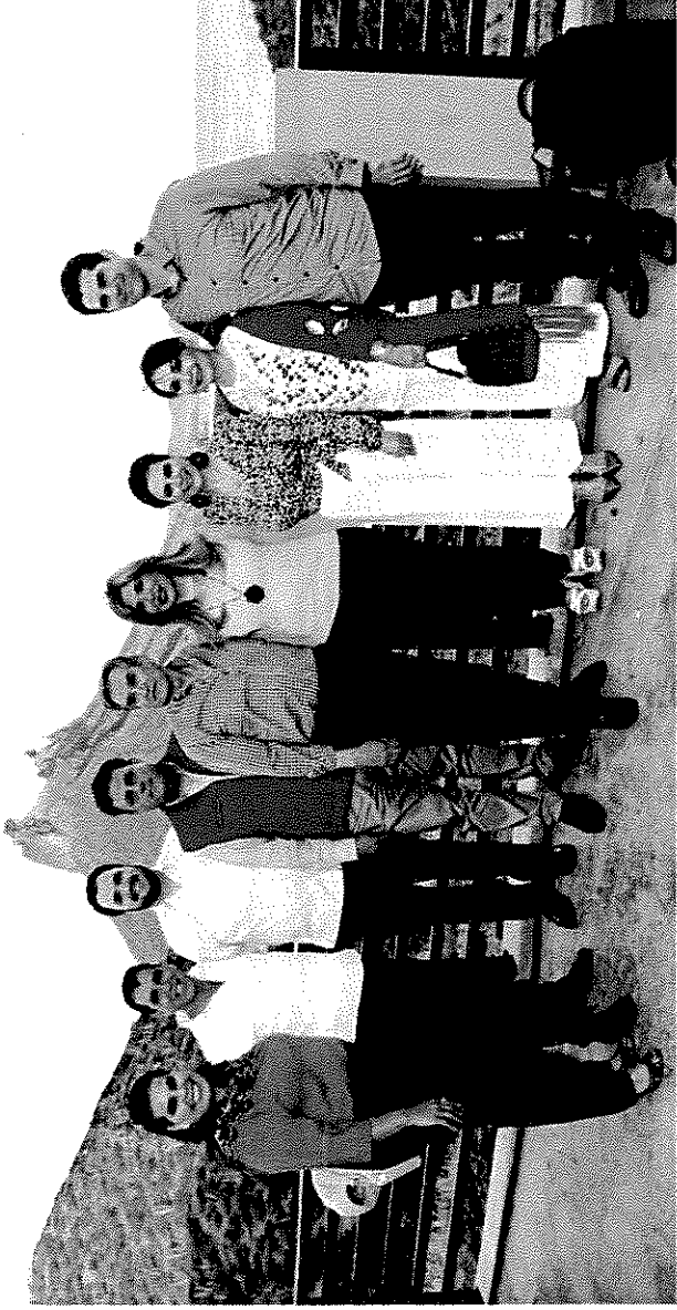
Asistencia a evento lanzamiento del Programa "Sonora con Actitur". San Carlos Guaymas, Sonora, 11 de abril de 2019.