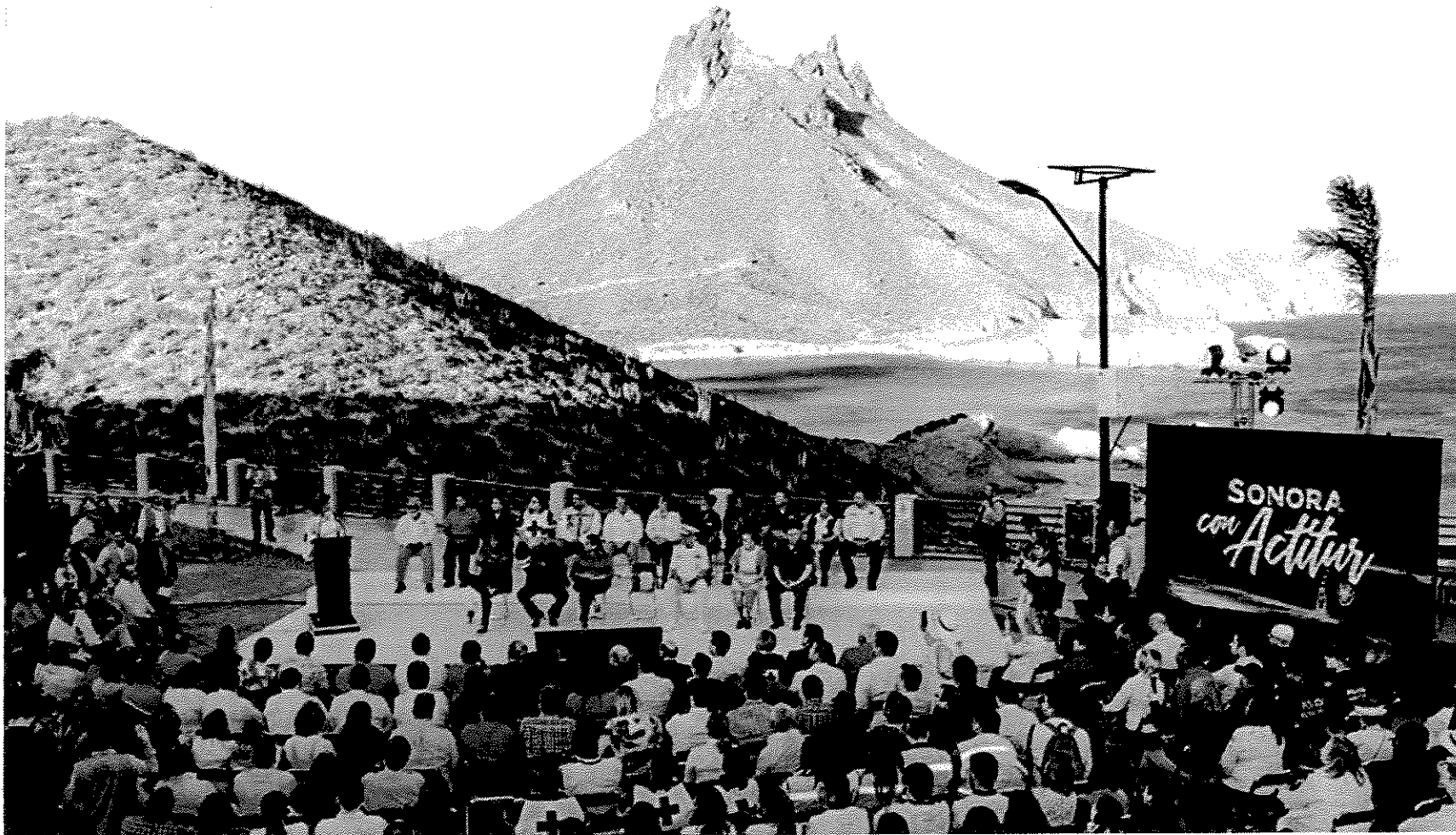
Evento de lanzamiento del Programa ACTITUR. San Carlos Guaymas, Sonora, 11 de abril de 2019.