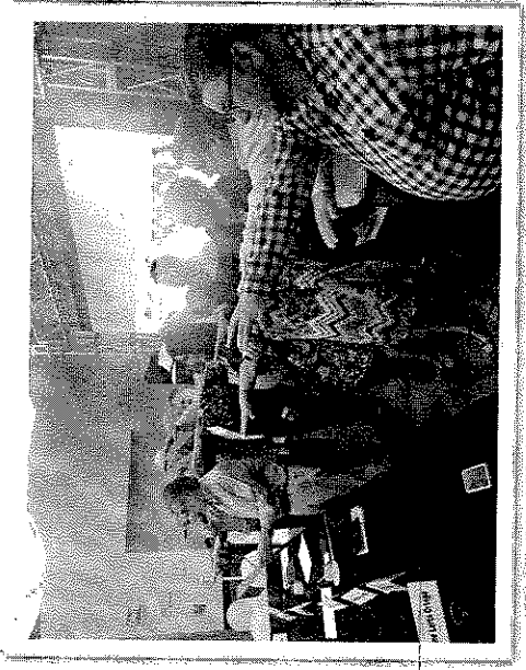
Toma de protesta del Comité Regional para el Desarrollo económico de Nogales.