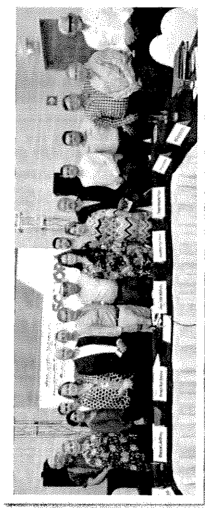
Reunión en Nogales, Sonora.

Igualmente el Secretario de Economía escucho las diferentes participaciones de los presidentes municipales respecto a temas económicos y fondo minero.