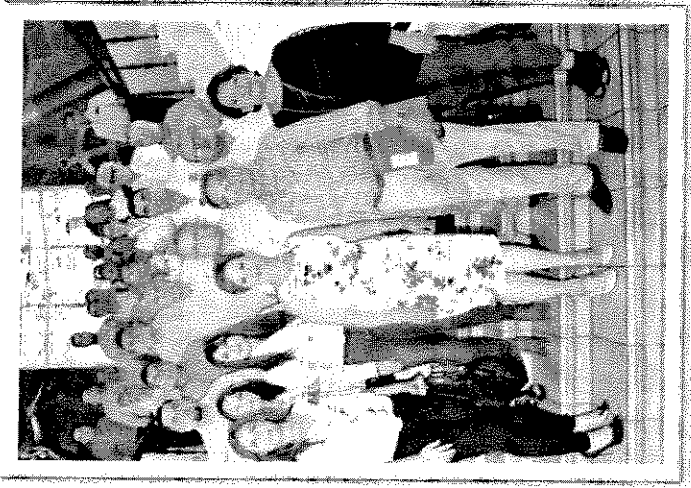
Instalación del Comité Regional para el Desarrollo Económico de Magdalena.