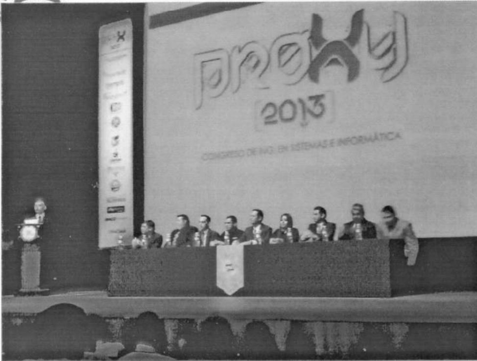
Imagen ceremonia de Inicio de congreso Proxy 2013 con directivos de ITH