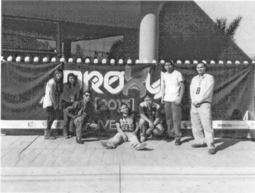
Imagen Frente a Teatro Auditorio del Cobach en el cual se Realizó el Congreso Proxy 2013