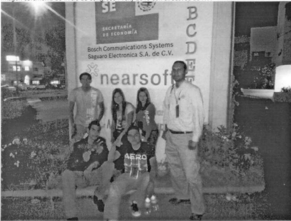
En empresa Nearsoft