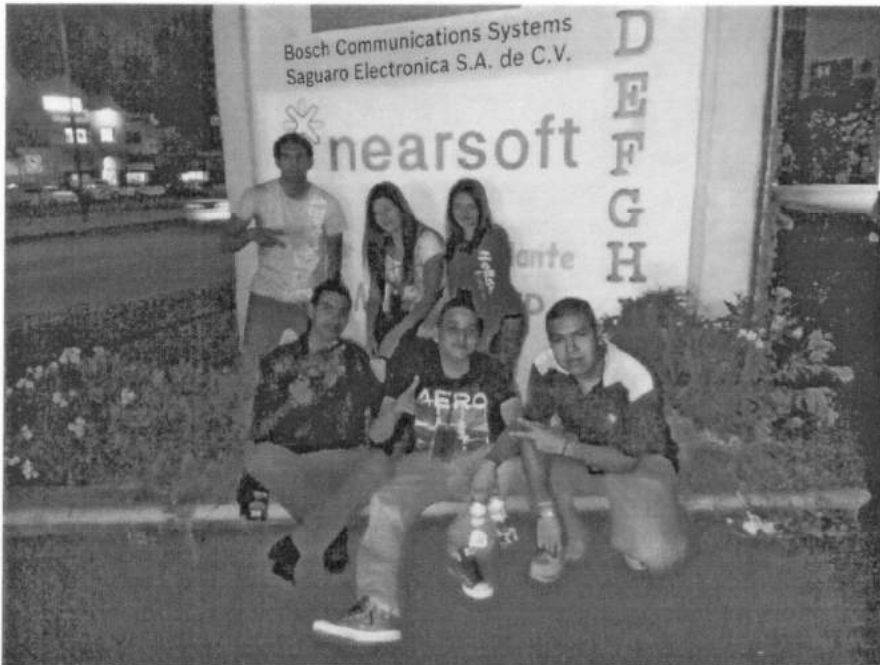
Imagen frente a la empresa de desarrollo de SW Nearsoft a la cual se realizó una visita