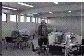
San Luis Rio Colorado