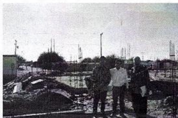
Golfo de Santa Clara