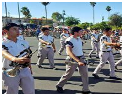
Tabla Comparativa 2016-2017 Cívico-Deportivo