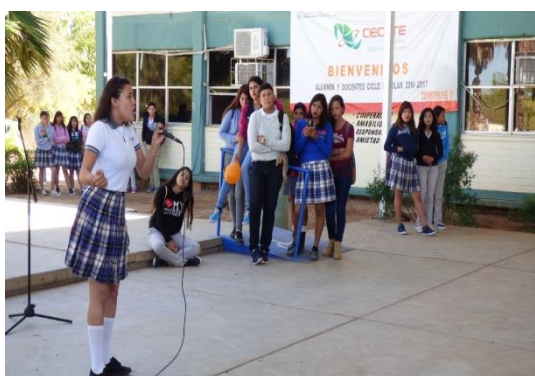
EMSaD Golfo de Santa Clara