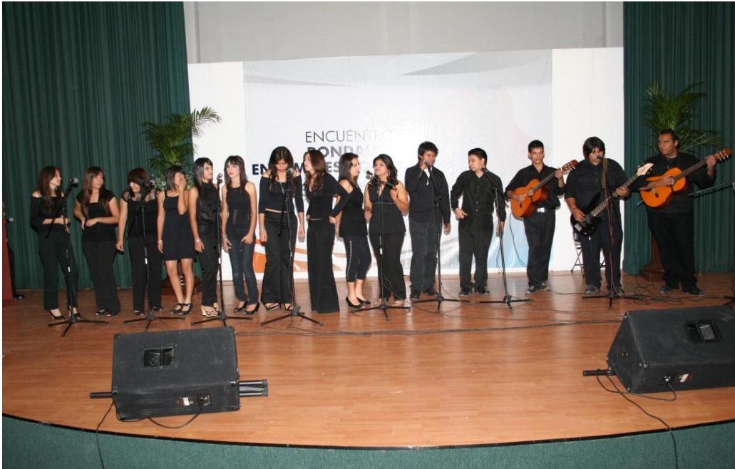
Rondalla y ensambles musicales CECyTES

Se llevó a cabo, durante noviembre, el Primer Encuentro de Rondallas y Ensamblés Vocales de CECyTES con la participación de 85 alumnos y 10 profesores de agrupaciones musicales de los planteles de Benjamín Hill, San Pedro El Saucito, Hermosillo II, Hermosillo I y Hermosillo III, pertenecientes a la zona centro.