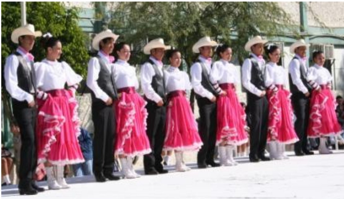
Bailable de jóvenes en el III Concurso académico y cultural estatal 2009.

La etapa estatal se realizó los días 26 y 27 de marzo del 2009 con la participación de 130 alumnos finalistas, de los cuales resultaron ganadores los que se indican en el Apéndice 7. Resultado de III Concurso Académico y Cultural Estatal 2009