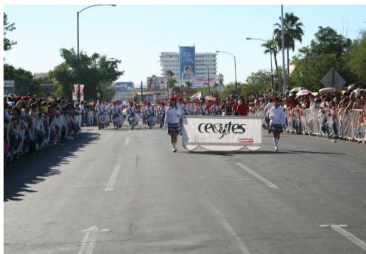
Participación del contingente cívico y deportivo del 16 de noviembre del 2009.

En respuesta a las convocatorias emitidas por la Secretaria de Educación y Cultura, a los desfiles cívico-militares del 16 de septiembre asistió un contingente de 318 participantes, y al cívico-deportivo del 20 de noviembre, nuestra banda de guerra monumental de 70 elementos, además de otros participantes.