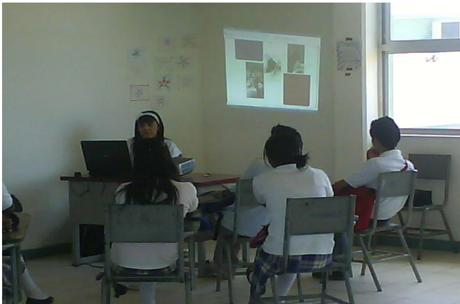
Alumnos de CECyTES tomando el Taller del programa de habilidades para la vida