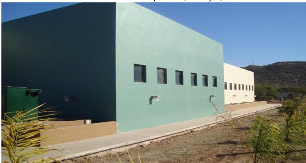
Plantel terminado en Buaysiacobe, Etchojoa, Sonora

Se concluyó la construcción del módulo integral para el plantel Buaysiacobe, con una inversión de $ 6, 900,314.53 consistente en un espacio cerrado que contiene cinco aulas, servicios sanitarios y bebederos, centro de cómputo, oficinas administrativas, áreas externas de esparcimiento para los jóvenes, todo con un moderno sistema de aprovechamiento de materiales térmicos, distribución de espacios e iluminación.