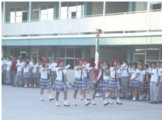
Celebración de un lunes cívico en el plantel Hermosillo I La Manga

El fomentar en la juventud mexicana el respeto a los valores cívicos y a los símbolos patrios de nuestra nación, coadyuvando a la formación integral de los alumnos de nuestro colegio, cada plantel celebra cuatro lunes cívicos haciendo honores a la bandera, se mencionan las principales efemérides y se presentan eventos culturales.