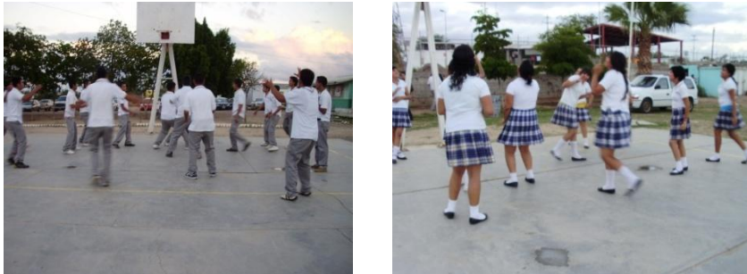
Clase de activación física en el plantel San Pedro El Saucito

Estos laboratorios de experiencias en los planteles con este programa piloto, en el año 2009, buscaron lograr una obligatoriedad de la actividad física y deporte incorporando por lo menos a los alumnos que cursen el 1° y 2° semestres.